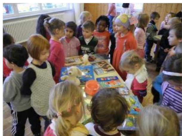
Imatge esquerra: Give Box – 2012 – Bèlgica; dreta: Activitat d'intercanvi amb nens - 2012 - Alemanya