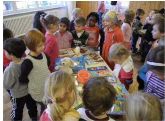
Sinistra: Box regalo – 2012 – Belgio, destra: Evento di baratto con I bambini - 2012 – Germania

► Settimana europea per la riduzione dei rifiuti: www.menorigiuri.org